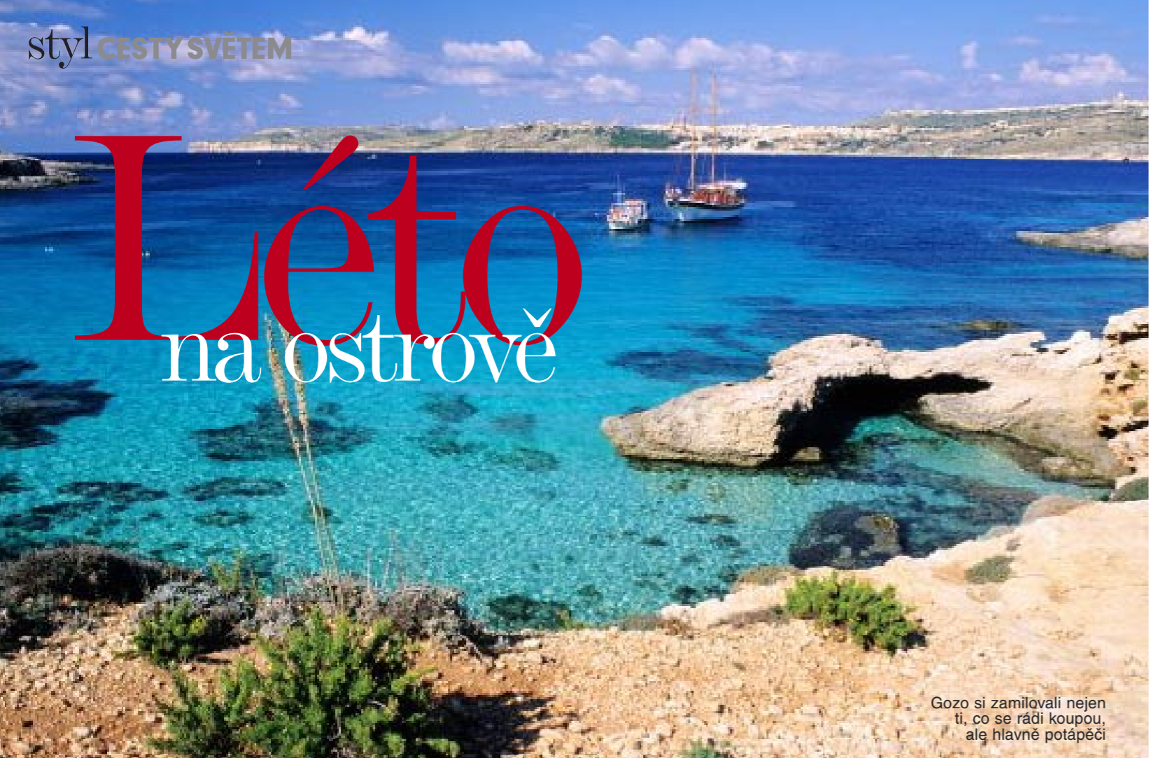
Gozo si zamilovali nejen ti, co se rádi koupou, ale hlavně potápěči