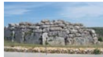
Toto jsou prý nejstarší kamenné zdi na světě, stěny svatyně Ggantija, uprostřed ostrova