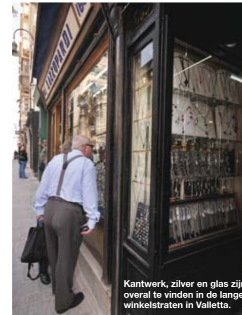
Kantwerk, zilver en glas zijn overal te vinden in de lange winkelstraten in Valletta.

Links: de waardevolste grondstof van de eilanden is het natuurlijk gesteente. Dit kalksteen, dat goudgeel van kleur is, heeft aan Malta de naam Melita, eiland van honing gegeven. Zowel vroeger als vandaag de dag wordt deze steensoort gebruikt voor de meeste bouwdoeleinden. De huizen passen daardoor in het landschap en lijken soms spontaan uit de grond omhoog te zijn gekomen.