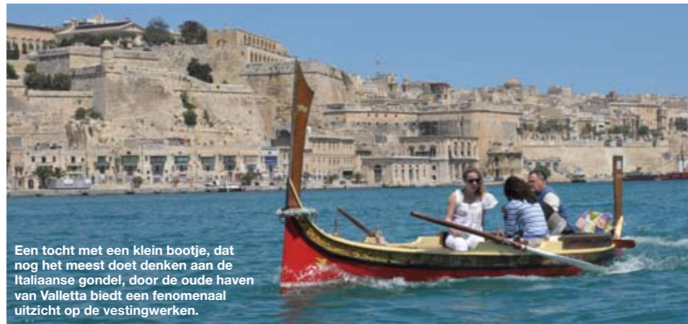
Een tocht met een klein bootje, dat nog het meest doet denken aan de Italiaanse gondel, door de oude haven van Valletta biedt een fenomenaal uitzicht op de vestingwerken.

De bezoeker moet op Malta wel aan meer zaken wennen. Zo is er het linksrijdende verkeer, een overblijfsel van het Brits koloniale tijdperk. En de azuurblauwe zee lonkt overal, maar de rotskust maakt een zwempartijtje een heuse onderneming. Verder is er een ware overvloed aan kerken en kappen, om precies te zijn 365; voor elke dag in het jaar een ander gebedshuis. En juist deze voorliefde voor bouwkunst lijkt Malta nu in een wurggreep te nemen. Het land raakt door de beperkte ruimte en de ongeremde groei verstikt te raken. Van de 350.000 inwoners heeft tweederde een auto. Verstopte wegen tijdens de ochtend- en avondspits behoren tot het dagelijkse straatbeeld. Desondanks blijft het openbaar vervoer werkelijk uitstekend geregeld. Malta is booming. Malta is fascinerend. Vooral voor de bezoeker die weet achter welke anonieme poort of façade de grootste schatten schuilgaan.