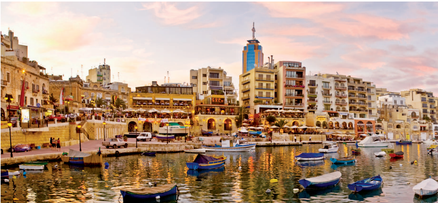
Hafenpromenade in St. Juliens, dem touristischen Zentrum Maltas, mit dem Hilton-Tower im Hintergrund.