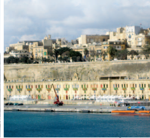
Blick vom Hafen Marsamxett auf Valletta; restauriertes Hafenviertel in Valletta mit modernem Terminal für Kreuzfahrtschiffe.

hen, die Malta 1530 von Kaiser Karl V. als Lehen übertragen bekamen. Nur 35 Jahre später mussten sie die Insel in einem furchtbaren Kampf gegen die Osmanen verteidigen. Trotz großer Übermacht der Angreifer gelang es den Christen, Malta zu halten und die Türken zum Abzug zu zwingen. Zum Dank für die „Retter des christlichen Abendlandes“