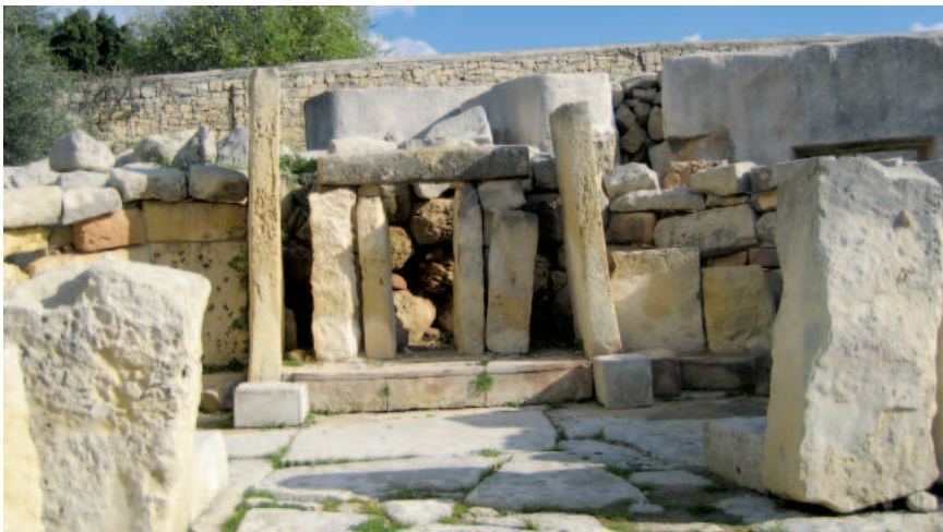
Tempelanlage von Tarxien aus 3600 bis 2500 v. Chr.

Wie der Alltag auf Malta für die einfachen Menschen wahrscheinlich schon immer war, kann man im Fischerdorf Marsamxlokk erahnen. Bunte Fischerboote, die typischen Luzzus, schaukeln im Wasser, auf dem sonntäglichen Markt gibt es vom frischen Fisch bis zur Unterwäsche alles, was man so braucht zum Leben. Heute wie eh und je. □