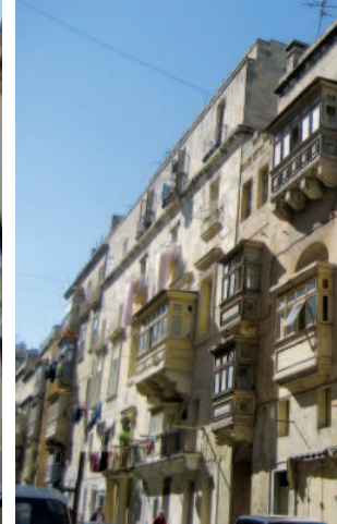
Von links nach rechts: Sonntagsmarkt in Marsaxlokk; Kathedrale in Mdina; Balkonlandschaft in Valletta.

> dies wie ein Fingerzeig Gottes gewesen sein. In Anerkennung des Mutes und der Tapferkeit während der Angriffe verlieh der damalige britische König Georg VI. der maltesischen Bevölkerung das Georgs-Kreuz, welches seitdem die maltesische Flagge ziert.