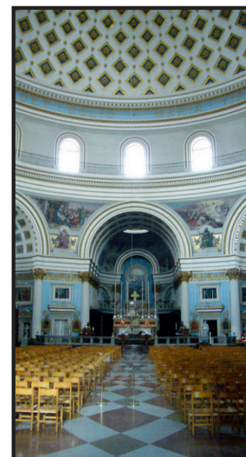
Mosta-Dom: Eine Bombe durchschlug die Kuppel. Wie durch ein Wunder detonierte sie nicht.