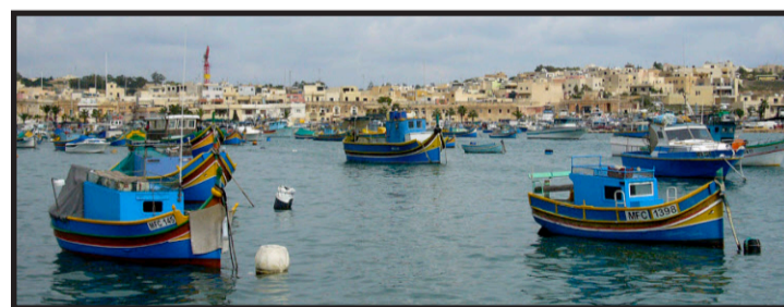
Luzzus-Boote: Die Horus-Augen am Bug sollen die Fischer beschützen.

ner kurzen Velofahrt und lässt ihren Blick über die Küstenlandschaft von Qbajjar mit ihren vielen Salzpfannen schweifen. Auf einem Spaziergang entlang der Klippen von Ta'Cenc erzählt sie später von guten Tauchgebieten. Und dort drüben im engen Tälchen, das das Wasser in den Kalkstein gefressen hat, finde jedermann eine passende Kletterroute. «So klein die Insel ist – Gozo hat viel zu bieten», sagt sie. Augenzwinkernd fügt sie hinzu: «Und Gozo ist noch ein Geheimtipp.» MATHIAS BORN