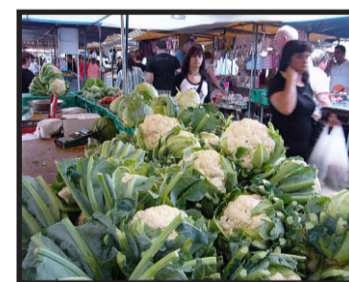
Marsaxlokk: Der grosse Markt.