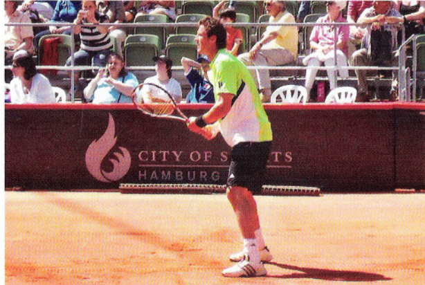
Marat Safin erwartet den Aufschlag.