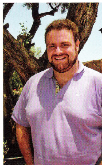
Auf Malta geliebt und verehrt: Joseph Calleja.